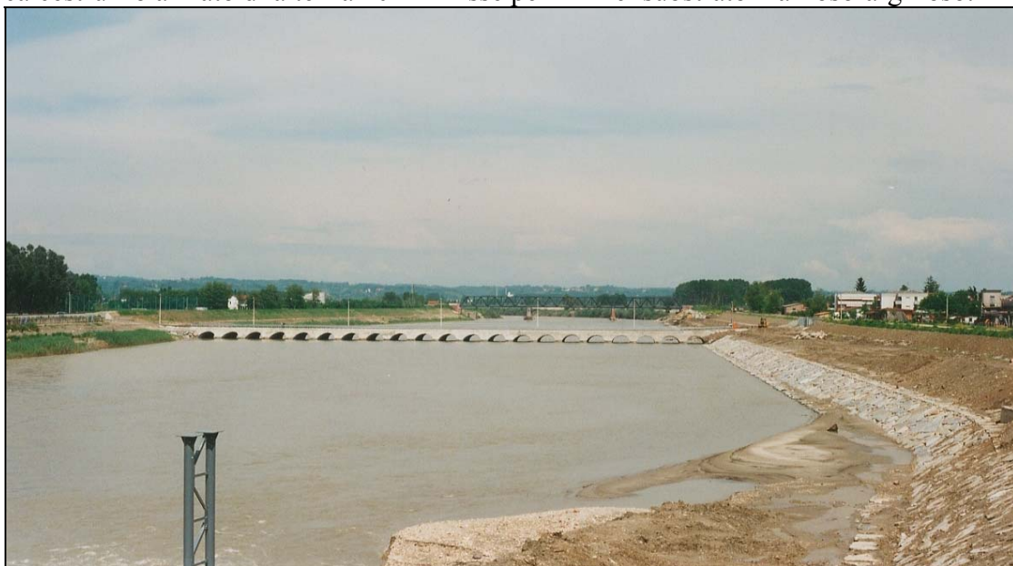
Fig. 1 – Interventi in fase d’esecuzione – ricalibratura e difesa spondale nel tratto cittadino in sponda destra (si nota il guado provvisorio, ora demolito).

SISTEMAZIONE Torrente Borbore – tutto il tratto cittadino del torrente Borbore, prima ampiamente insufficiente per le portate di riferimento, è stato oggetto d’interventi di ampliamento della sezione di deflusso e di realizzazione di difese spondali ed arginali. In particolare, l’ultimo tratto fino alla foce in Tanaro, è stato oggetto, contemporaneamente alla costruzione delle nuove arginature, di un notevole ampliamento della sezione di deflusso (da circa 140 m 2 a 270 m 2 ), al fine di abbattere gli elevati livelli idrici, non compatibili con le infrastrutture presenti in zona. Tale intervento è stato realizzato mediante opere di contenimento con paratie tirantate in calcestruzzo armato di altezza 10 m infisse per 4m nel substrato marnoso-argilloso.