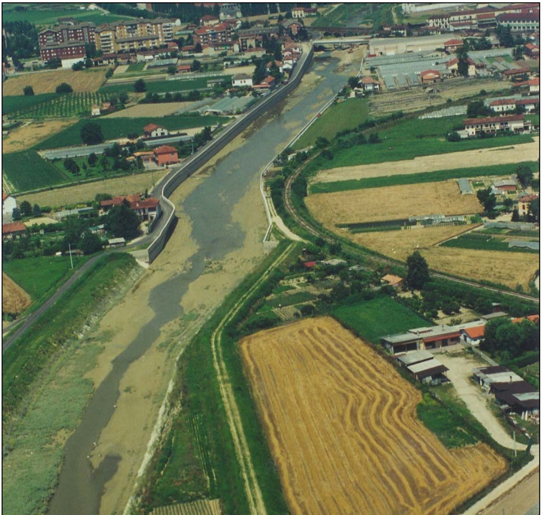
Fig. 3 – Interventi ultimati – Sistemazione tratto terminale T. Borbore.