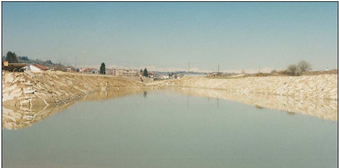
Fig. 2 – Interventi in fase d'esecuzione – deviazione foce Borbore.

Tanaro, sono stati intercettati con manufatti (chiaviche), mentre per l'altro affluente principale: il torrente Versa, si sono realizzati argini di rigurgito.